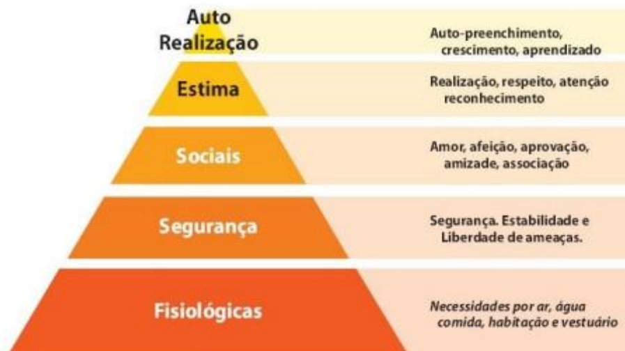
Figura 3 - Hierarquia das necessidades de Maslow

Fonte: Adaptado de Kotler e Keller (2013).