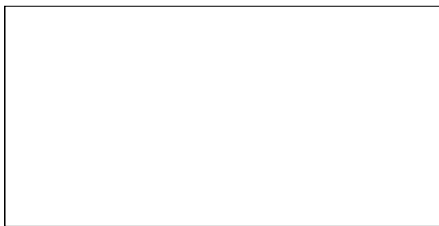
Quadro 1 – Título