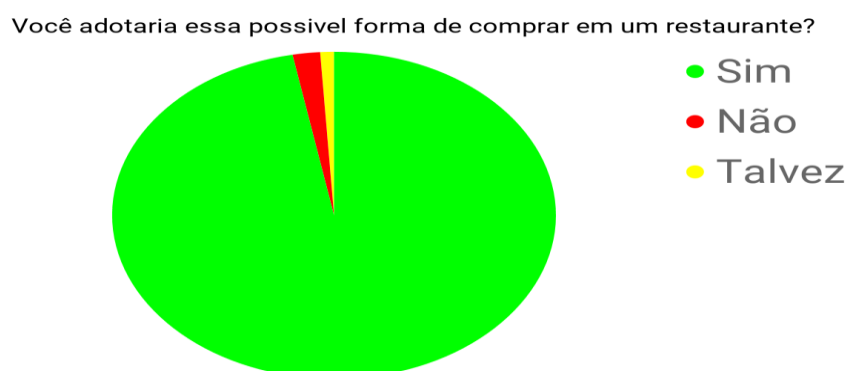
Gráfico 1 - Percentual avaliado em relação às respostas obtidas nesta pergunta.

No Gráfico 1 avaliamos o percentual de uma das questões levantadas no questionário e é perceptível uma aceitação inicial dos entrevistados em relação essa possível forma de compra em restaurantes, sendo que 97% disseram que adotariam a hipótese, 2% responderam que não, pois não possuíam aparelhos para usufruir do aplicativo ou não tinham acesso à internet.