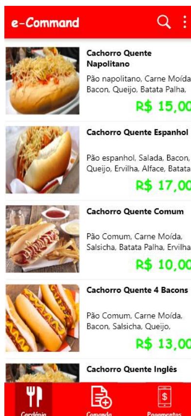
Figura 2 - Tela principal do aplicativo onde está contido o cardápio do dia